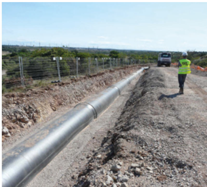
Aqua Domitia (BRL)

La gestion durable de la ressource en eau est une question cruciale pour la région qui souffre d'une insuffisance en eau. La Région a décidé d'activer une politique publique de l'eau de grande ampleur en utilisant les compétences de la SEM locale BRL dont la Caisse des Dépôts est actionnaire de longue date. Le projet Aqua Domitia est le plus important programme réalisé en France depuis 30 ans. Avec 300 M€ de travaux réalisés par BRL, l'alimentation en eau d'une centaine de communes sera sécurisée entre Montpellier et Narbonne. A cette fin, en 2013, BRL a lancé une augmentation de capital de 7 M€ à laquelle la Caisse des Dépôts a participé à hauteur de 938 K€.