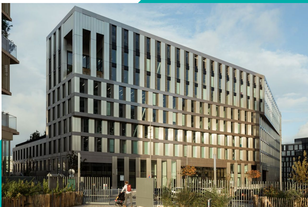
Immeuble ENJOY

Au niveau du Groupe, le secteur immobilier est à la fois structurant pour les entités financières du Groupe, en effet il est l'un des premiers bénéficiaires de financements et d'investissements, notamment via les prêts au logement social de la Banque des Territoires et les prêts immobiliers de la Banque Postale, et il constitue l'un des secteurs d'activités de plusieurs entités opérationnelles comme CDC Investissement Immobilier, CDC Habitat, Icade et la Poste Immobilier.